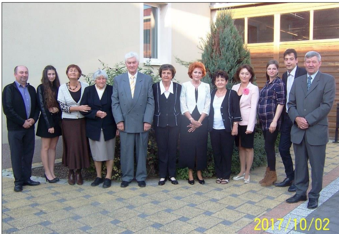
Családtagok a 8. kötet könyvbemutatóján. Fertőszentmiklós, 2017. 10. 02.

Szakmai kapcsolataink egyre szélesebbé váltak. A megye városaiban működő könyvtárak, állami és egyházi levéltárak, muzeális kiállítóhelyek beépítik programjaikba alapítványunk kínálatát, és helyet adnak rendezvényeinknek. Szívesen fogadják kutatóinkat, és szakmai anyagokkal látják el őket. Az intézmények vezetői, dolgozói maguk is feladatokat vállalnak tevékenységünk elemzésében, bemutatásában, értékelésében. Különösen jó kapcsolatot alakítottunk ki az évek során a Csornai Muzeális Kiállítóhellyel a soproni Pedagógusok Művelődési Házával, a győri Dr. Kovács Pál Megyei Könyvtár és Közösségi Tér dolgozóival illetve intézményeivel, a megyei levéltárakkal és több oktatási intézménnyel. Régiós kapcsolataink közül kiemelkedik a Pápa városával kialakított szakmai együttműködés, melynek eredményeként a jövőben több közös program megvalósítására kerülhet sor. Több éve tartunk kapcsolatot a debreceni Dr. Karácsony Sándor Pedagógiai Egyesülettel, mely hasonló módon végez értékteremtést és értékőrzést pedagógus életutak közreadásával.