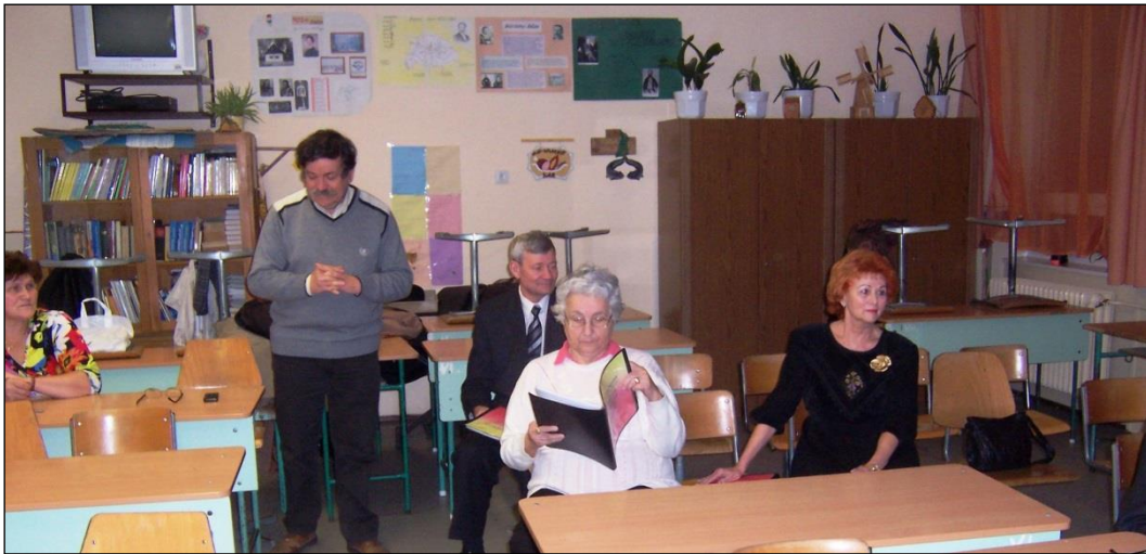
A darnózseli polgármester köszöntője (2017. 11. 30.)

Kedvező tapasztalat számunkra polgármesteri hivatalok dolgozóinak, elsősorban a polgármestereknek a bekapcsolása rendezvényeinkbe. Az önkormányzatok támogatóként is megjelennek lehetőségeik mértékének megfelelően.